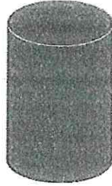
Şekil 3 Ceza Atığı

Beyaz alan içerisinde hakemler tarafından sahanın merkezine yerleştirilmiş, diğer atıklarla aynı ölçüde farklı renkteki atıktır.