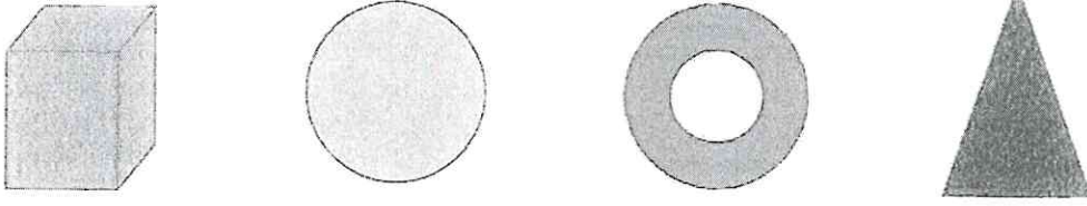
Şekil 2 Örnek atıklar.(Boyutları belirtilen ölçüler aralığında kalarak atıklar yukarıdaki şekillerdeki gibi olacaktır.)

Yarışmacılar için 10 tane atık malzeme, alan içerisine hakemler tarafından rastgele yerleştirilir. Atıklar zeminde olabileceği gibi 10mm ile 500mm arasındaki yüksek sehpa üzerinde olabilir. Temsili atıklar için yaklaşık boyut 50mm-100mm çapında, 20mm-100mm yükseklikte silindir şeklindedir. Atıklar plastik, ahşap ve metal malzemeden imal edilmiş olup maksimum 100gr ağırlığındadır.